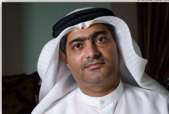
Ahmed Mansoor (Émirats Arabes Unis)