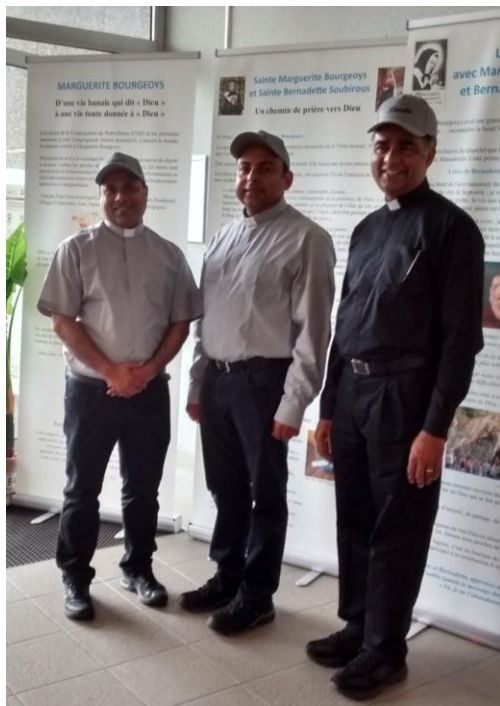
des pèlerins venant du Pakistan