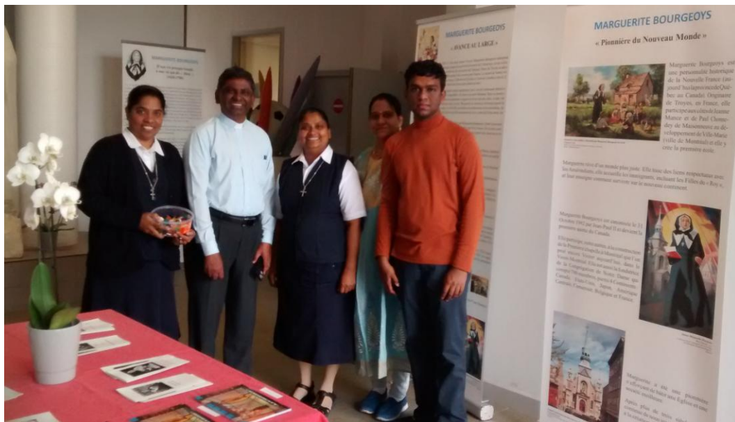
des pèlerins venant de l'Inde