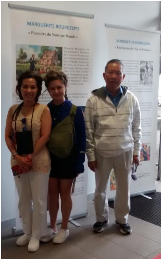
des pèlerins venant d'Italie