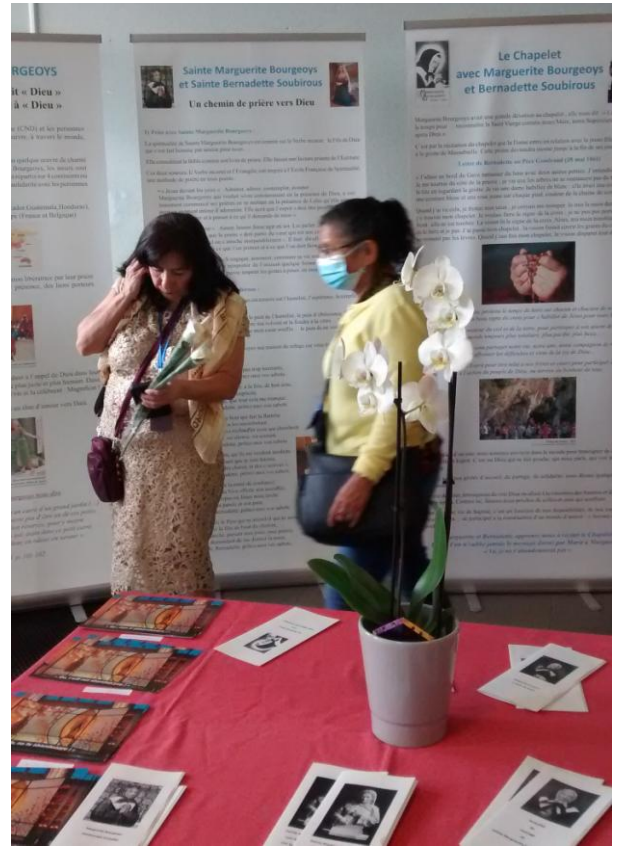
des pèlerines venant d'Amérique Centrale