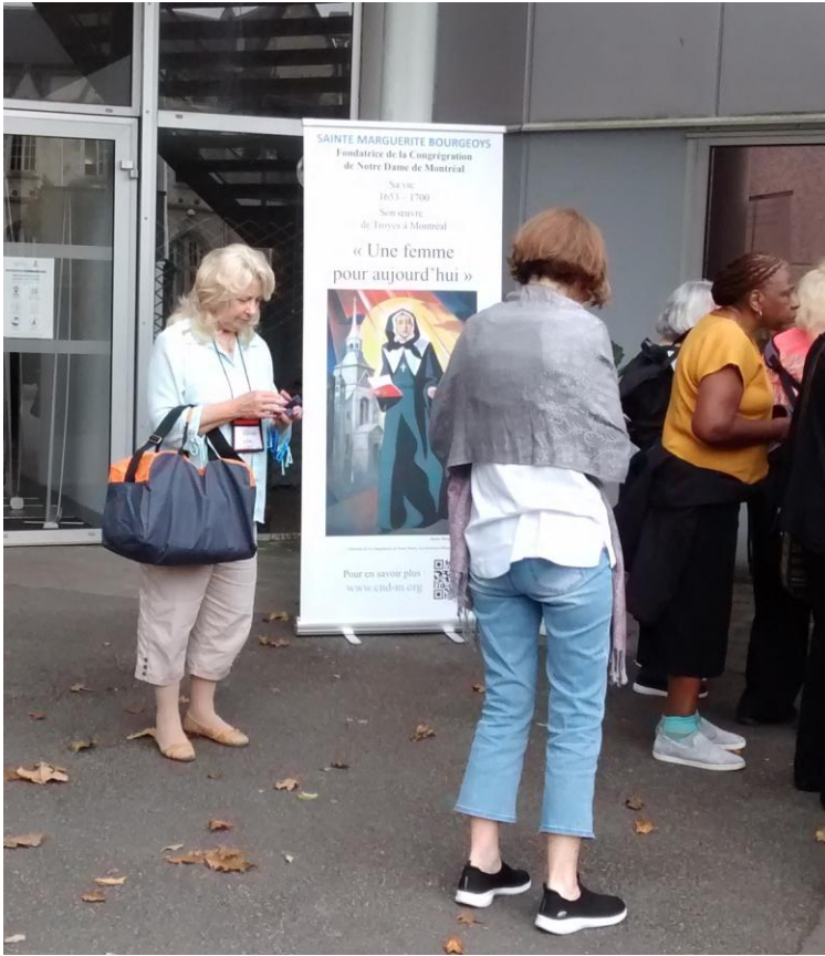
Un groupe de pèlerins venant d'Angleterre

Lourdes est vraiment un lieu de l'Église universelle.