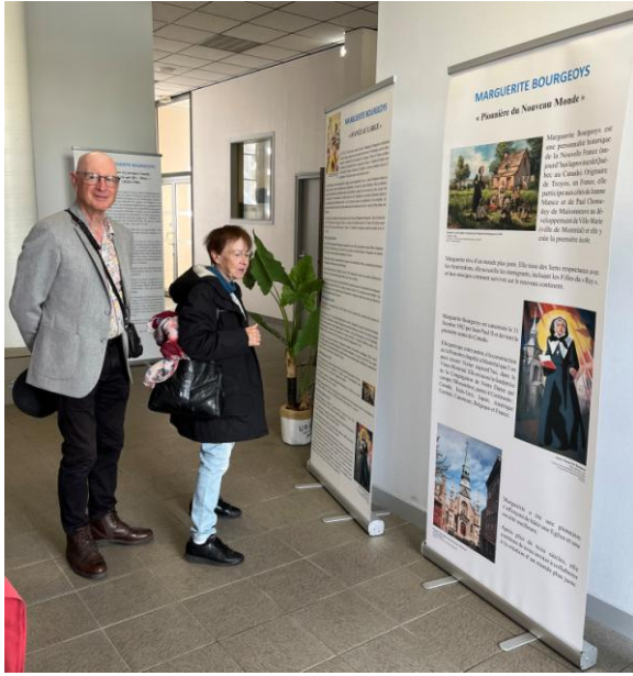
des pèlerins Français de passage